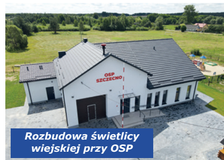
Rozbudowa świetlicy wiejskiej przy OSP

37.638,78 zł przeznaczono na zadania: budowa drogi gminnej; mo-