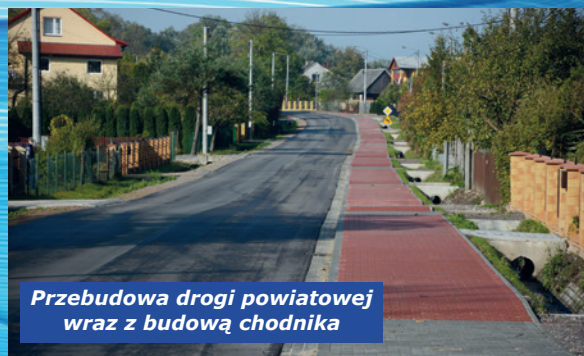
Przebudowa drogi powiatowej wraz z budową chodnika