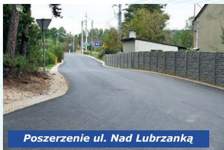
Poszerzenie ul. Nad Lubrzanką