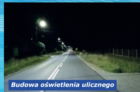
Budowa oświetlenia ulicznego