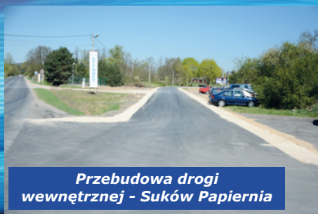
Przebudowa drogi wewnętrznej - Suków Papiernia