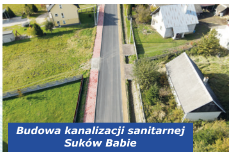
Budowa kanalizacji sanitarnej Suków Babie