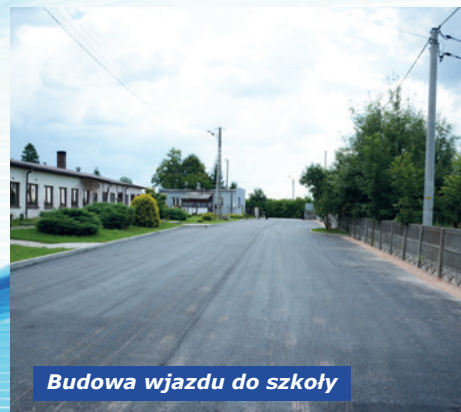
Budowa wjazdu do szkoły

50.134,66 zł przeznaczono na zadania: organizacja imprez integracyjnych; doposażenie budynku świetlicy wiejskiej; utrzymanie czystości i porządku na terenie sołectwa.