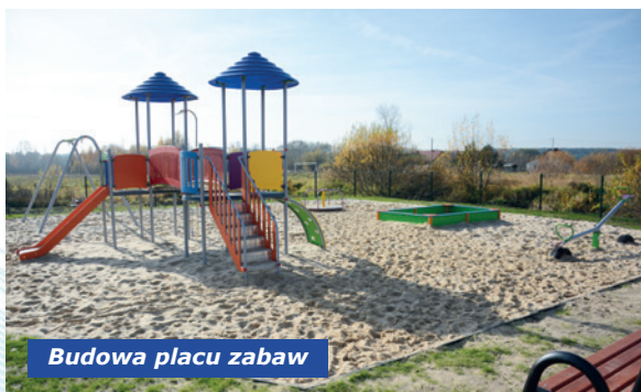
Budowa placu zabaw