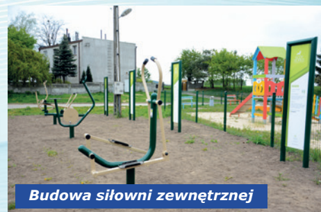
Budowa siłowni zewnętrznej