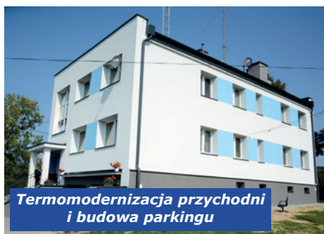
Termomodernizacja przychodni i budowa parkingu

modernizacja instalacji wodno-kanalizacyjnej w ośrodku zdrowia; monitoring na boisku SP w Szczecnie; dofinansowanie świetlicy wsparcia środowiskowego; zakup wyposażenia dla KGW; zakup wyposażenia dla OSP; budowa obelisku koło szkoły; organizacja imprez integracyjnych.