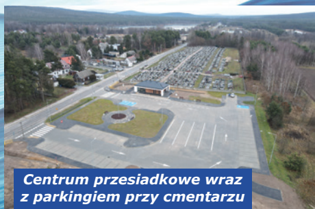
Centrum przesiadkowe wraz z parkingiem przy cmentarzu

53.734,90 zł przeznaczono na zadania: wykonanie dokumentacji projektowej wraz z montażem instalacji fotowoltaicznej na budynku OSP; remont budynku świetlicy OSP; wydatki związane z funkcjonowaniem Klubu Seniora; organizacja imprez integracyjnych.