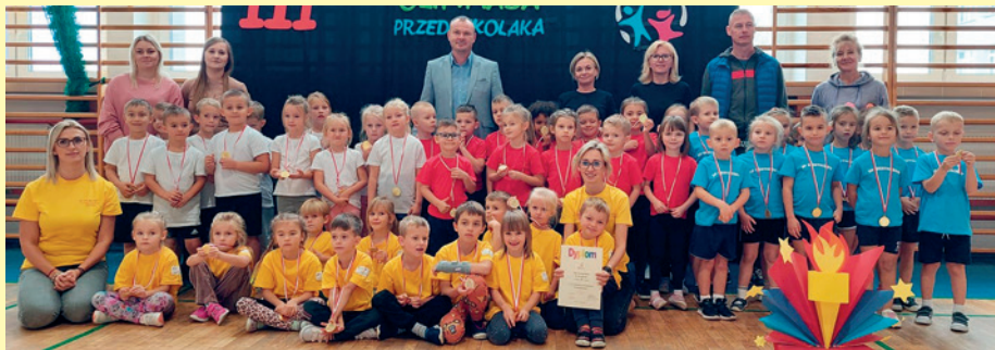
I miejsce i najlepszy wynik uzyskały przedszkolaki z Daleszyc i tym samym zakwalifikowały się do etapu powiatowego.

ty przygotowań były wspaniałe. Nasze przedszkolaki pokazały ogromne zaangażowanie i radość z uprawiania sportu i pracy w zespole. Co najważniejsze, rywalizacji towarzyszyło mnóstwo zapału i radości. Wszystkie dzieci biorące udział w zawodach zostały nagrodzone i otrzymały pamiątkowe medale.