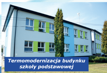
Termomodernizacja budynku szkoły podstawowej

48.021,40 zł przeznaczono na zadania: rozbudowa garażu przy OSP; wy-