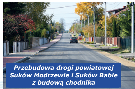
Przebudowa drogi powiatowej Suków Modrzewie i Suków Babie z budową chodnika

40.867,30 zł przeznaczono na zadania: opracowanie dokumentacji projektowej na oświetlenie uliczne Suków Babie w kierunku ul. Dymińskiej oraz od posesji 113 do 114 Suków Babie; rozbudowa platformy wysiadkowej Suków Babie wraz z montażem wiaty przystankowej oraz przygotowanie podbudowy i montaż