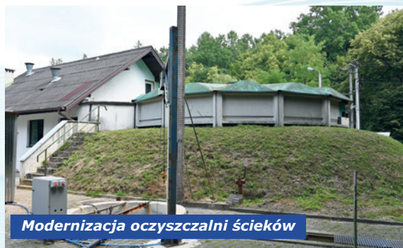
Modernizacja oczyszczalni ścieków