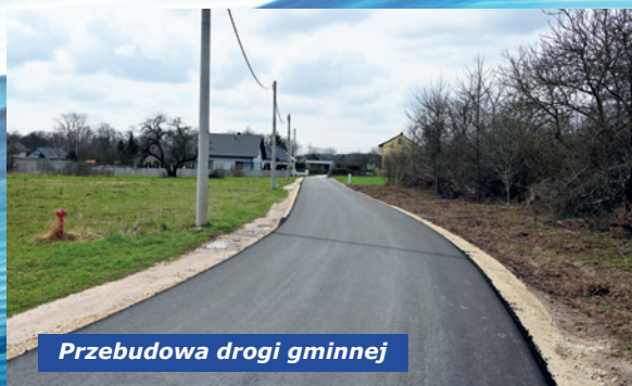
Przebudowa drogi gminnej