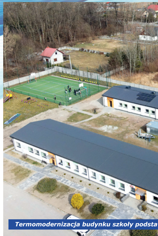
Termomodernizacja budynku szkoły podsta

34.540,60 zł przeznaczono na zadania: przebudowa drogi wewnętrz-