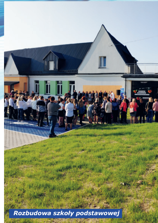
Rozbudowa szkoły podstawowej

41.699,30 zł na zadania: doposażenie Sali gimnastycznej i przedszkola; doposażenie budynku OSP; organizacja imprez integracyjnych; zakup wyposażenia dla KGW w Nie-