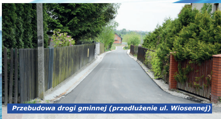
Przebudowa drogi gminnej (przedłużenie ul. Wiosennej)

53.734,90 zł na zadania: wyposażenie świetlicy wiejskiej; utwardzenie kostką dojazdu do świetlicy wiejskiej przy OSP; zakupy do szkoły; organizacja imprez integracyjnych i patriotycznych.