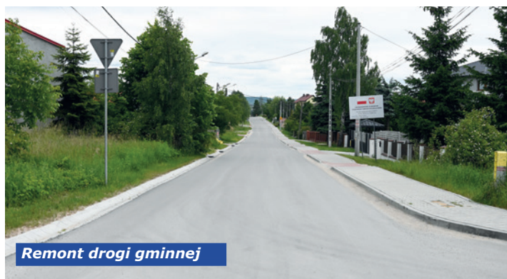
Remont drogi gminnej