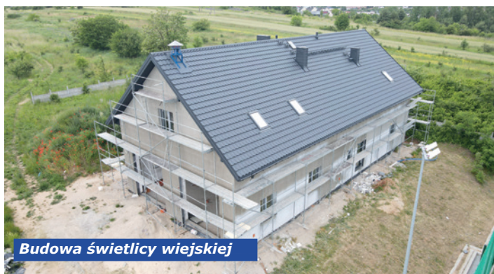
Budowa świetlicy wiejskiej