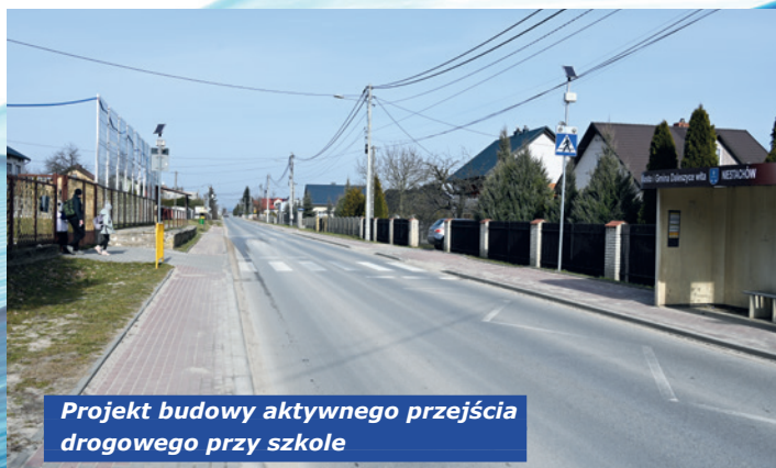
Projekt budowy aktywnego przejścia drogowego przy szkole