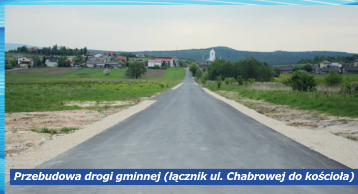
Przebudowa drogi gminnej (łącznik ul. Chabrowej do kościoła)