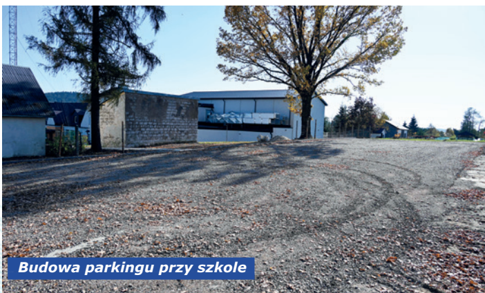
Budowa parkingu przy szkole

48.021,40 zł na zadania: przygotowanie terenu pod siłownię zewnętrzną; utwardzenie terenu przy szkole podstawowej na potrzeby parkingu;