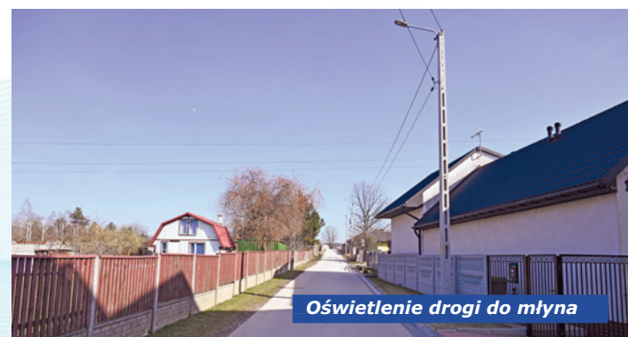
Oświetlenie drogi do młyna