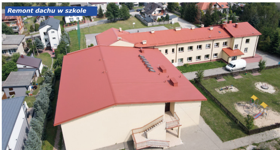
Remont dachu w szkole

dla OSP w Mójczy, organizacja imprez integracyjnych.