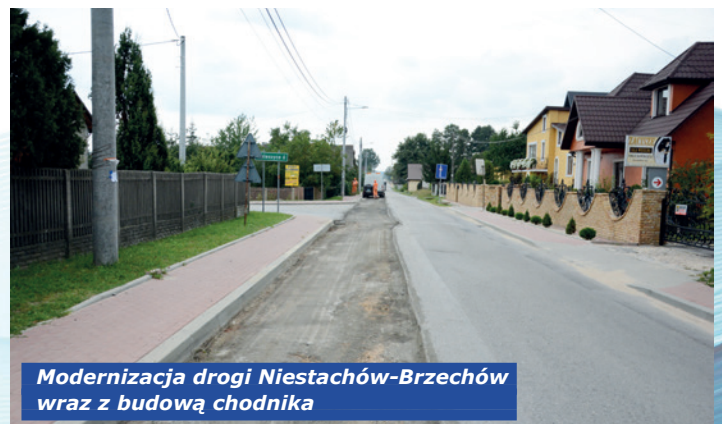
Modernizacja drogi Niestachów-Brzechów wraz z budową chodnika