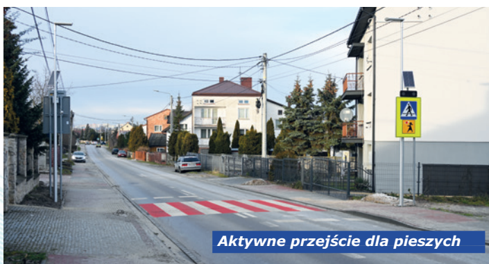
Aktywne przejście dla pieszych