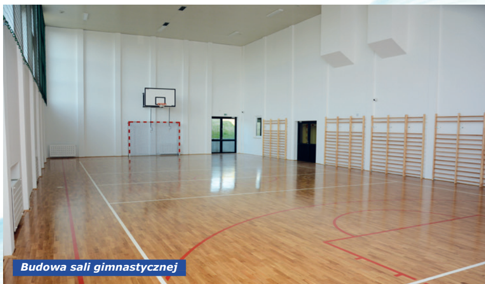
Budowa sali gimnastycznej

53.734,90 zł na zadania: utrzymanie budynku remizy na potrzeby klubu seniora; wykonanie dokumentacji projektowej oraz remont Sali lekcyjnej na terenie szkoły podstawowej; wykonanie dokumentacji projektowej na rozbiórkę budynków gospodarczych i budowę budynku gospodarczego; organizacja imprez integracyjnych dla mieszkańców; remont w pomieszczeniach budynku OSP; zakup i montaż luster drogowych oraz tabliczek z numerami dojazdowymi do posesji.