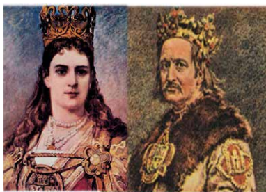
Królowa Jadwiga i król Władysław Jagiełło – J. Matejko