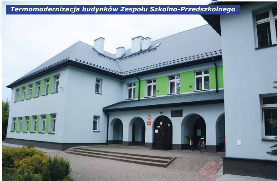
Termomodernizacja budynków Zespołu Szkolno-Przedszkolnego

5 sztuk, ul. Głowackiego 9 sztuk, ul. Zagórze 14 sztuk.