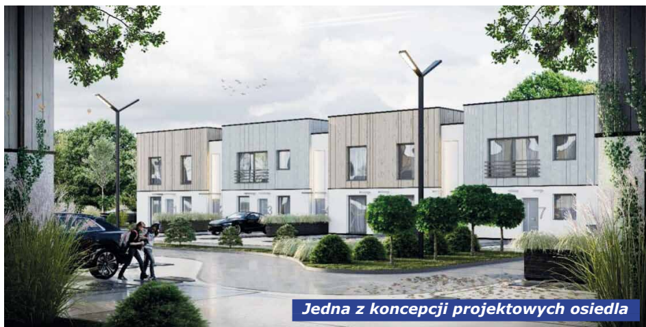
Jedna z koncepcji projektowych osiedla

Oferta spółki skierowana jest do osób, które nie mają zdolności kredytowej, ale ich możliwości finansowe pozwolą opłacać czynsz. Z drugiej strony ich dochody są zbyt wysokie, by przyznano im lokal komunalny. To ważna inicjatywa szczególnie dla młodych małżeństw, które nie mają zdolności kredytowej, aby mogły zamieszkać w lokalu, który stanie się ich własnością. Każda rodzina, opłacając umiarkowany czynsz będzie z każdym miesiącem zbliżać się do bycia właścicielem mieszkania.