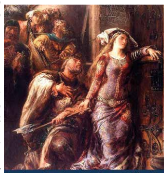
Dymitr z Goraja i Jadwiga – J. Matejko