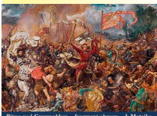
Bitwa pod Grunwaldem – fragment obrazu – J. Matejko